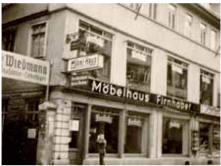
Das Ladengeschäft in den 30er Jahren