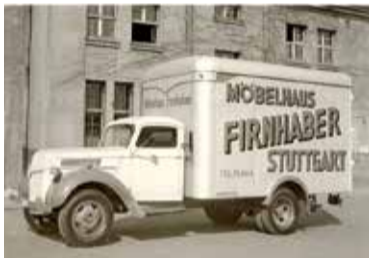
Erster LKW nach dem Krieg

50er, 60er Jahre Die Ausstellungsfläche in der Stuttgarter Innenstadt wird kontinuierlich größer. Das Unternehmen wächst beständig.