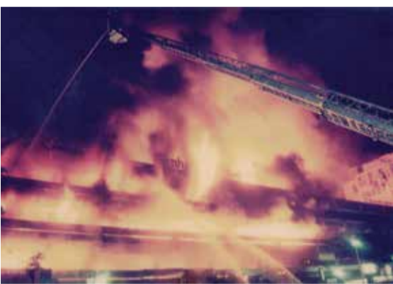
Großbrand im Juni 1992

1992 Am 22. Juni versucht ein wahnwitziger Kneipier seine finanzielle Lage durch Versicherungsbetrug zu verbessern. Er schüttet 60 Liter Benzin in seinem Lokal aus und zündet sie an.