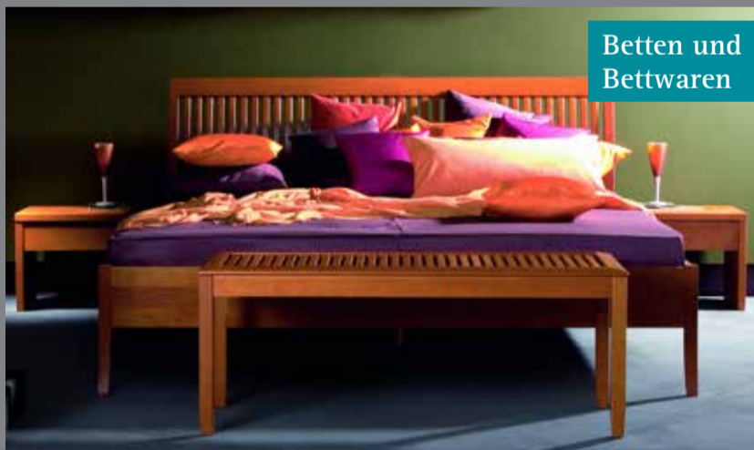
Betten und Bettwaren