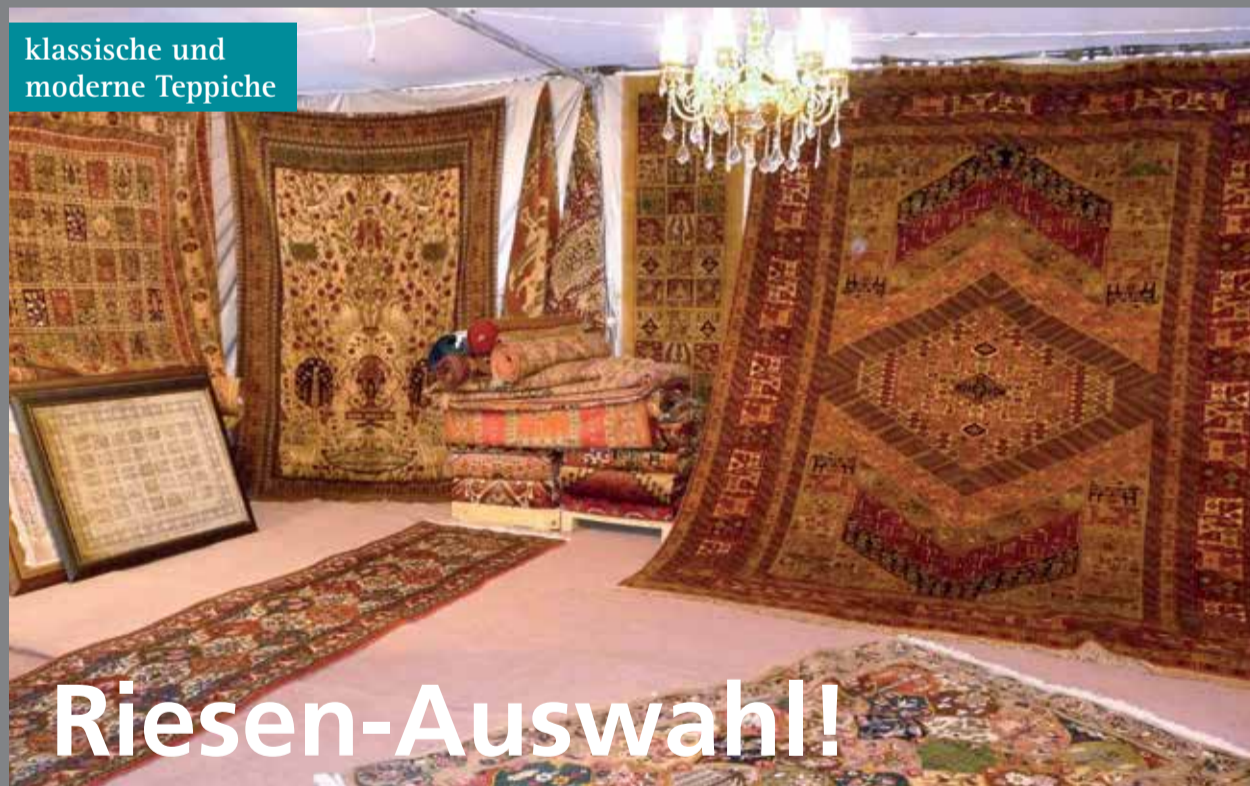
klassische und moderne Teppiche