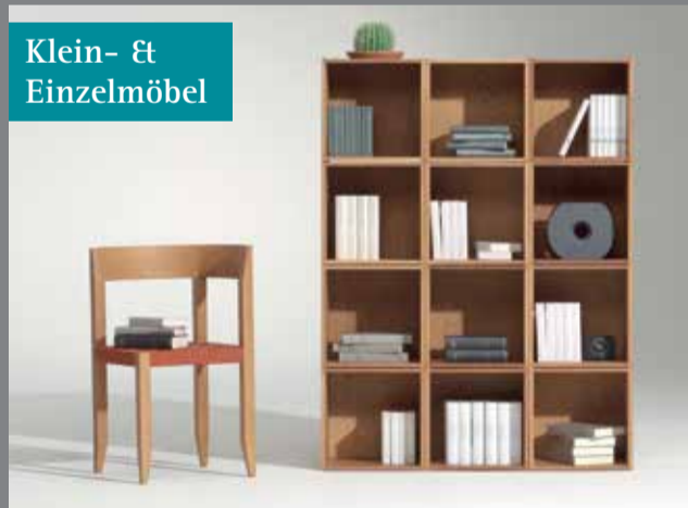
Klein- & Einzelmöbel