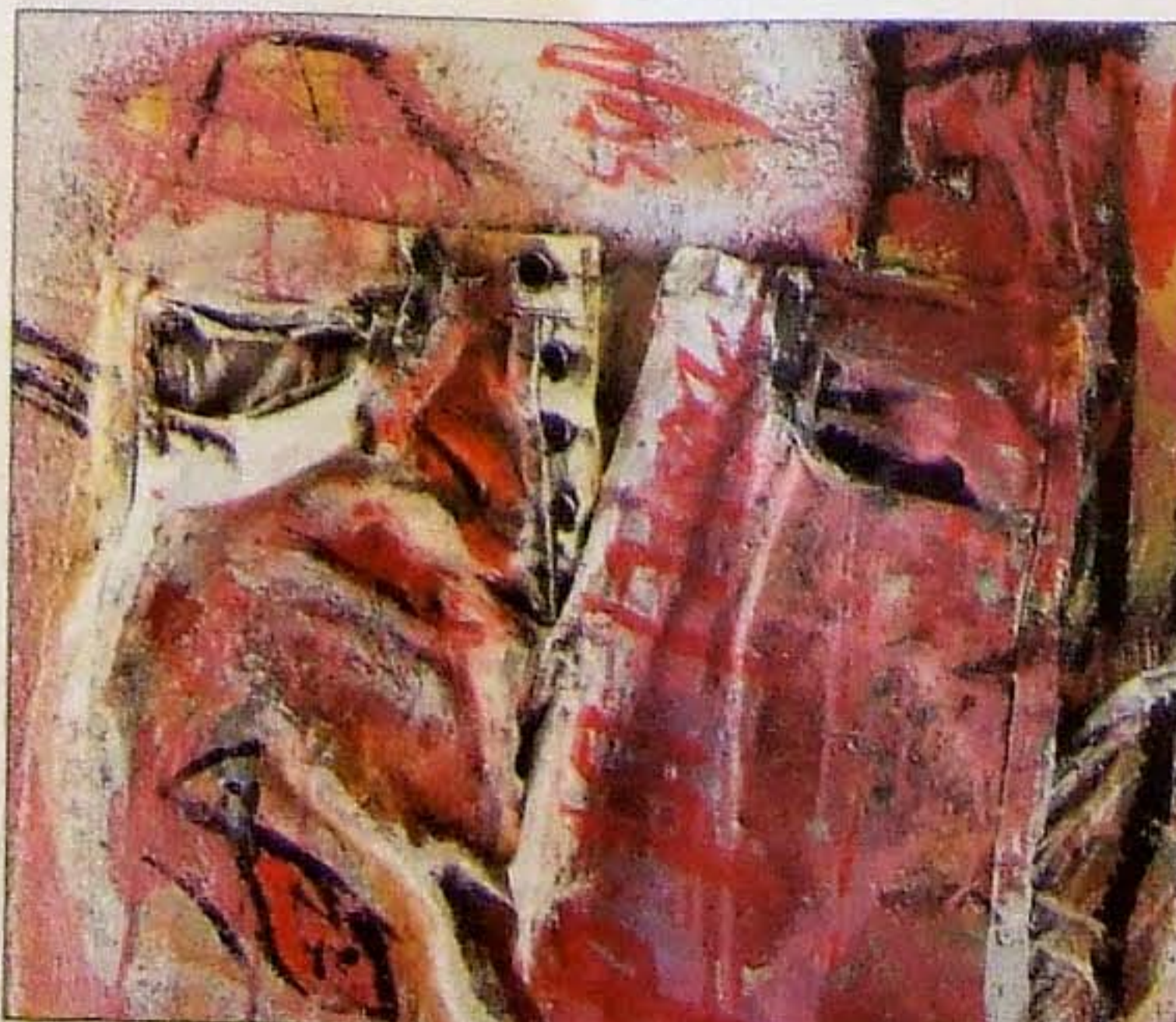
„Hosenfisch mit Hemd“ heißt das Bild von Peter Feichter, das neben anderen im Einrichtungshaus Firnhaber ab 16. Oktober zu sehen ist.

■ Stuttgart-Ost: Ausstellung mit Werken von Peter Feichter im Firnhaber Einrichtungshaus