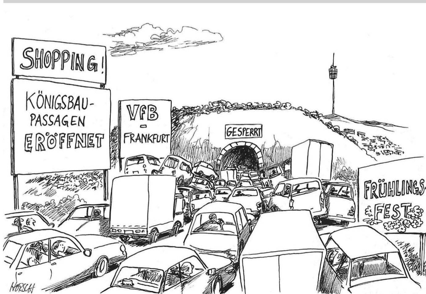
Alle Räder stehen still, wenn der Bürokrates will