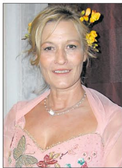
Auf Stippvisite in Stuttgart: Suzanne von Borsody.

Der Alltag von Suzanne von Borsody gleicht einer Nonstop-Deutschlandtournee. Heute ist sie in Stuttgart, morgen in Jena. Stress empfindet sie dennoch nicht. „Warum auch“, fragt sie. „Ich habe schließlich das Glück meine Vorlieben auszuüben.“ Und diese sind breit gefächert. Die preisgekrönte Charakterdarstellerin engagiert sich für notleidende Kinder, malt in ihrer Freizeit – vorwiegend Landschaften, wie sie sagt –, hält Lesungen in zahlreichen Städten. Auch das Theater ist ihre