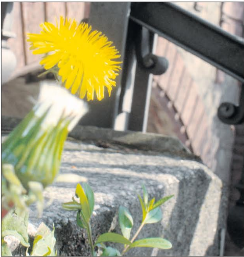
Auf den Treppen neben den Tunnelöffnungen bahnt sich die Natur ihren Weg.