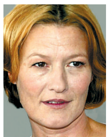
Südsee am Gaskessel: Susanne von Borsody