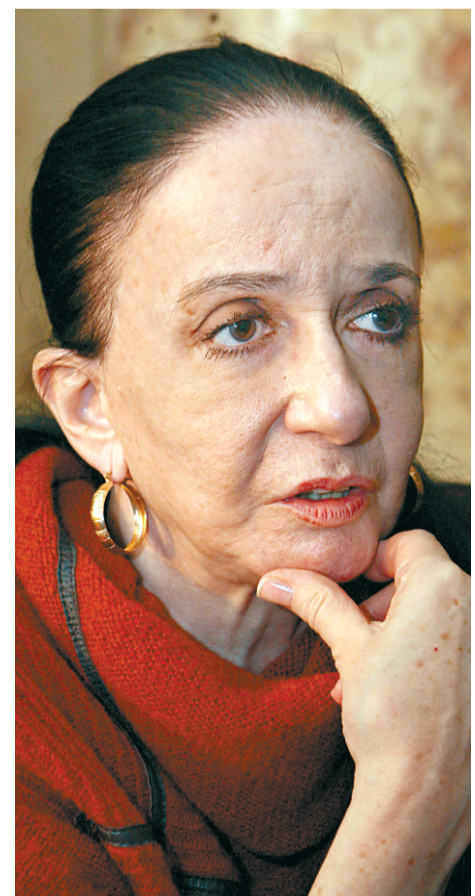
Prima, Ballerina: Márcia Haydée feiert ihren Siebzigsten gleich dreimal.