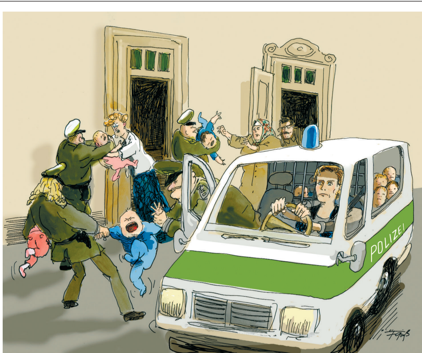
Wird Kindergarten zur Pflicht?